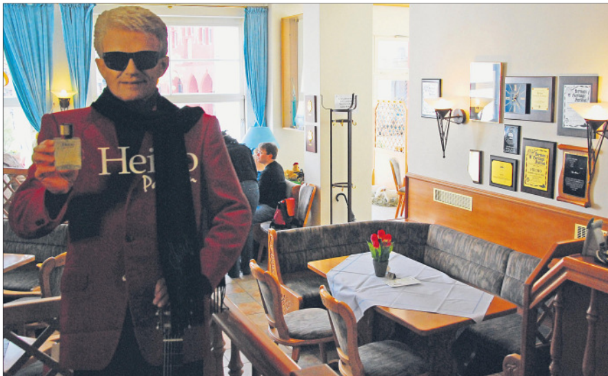
Von Heinos Rathaus-Café, zu dem auch ein Fanshop gehört, blicken die Besucher auf den Verwaltungssitz des Kurortes.