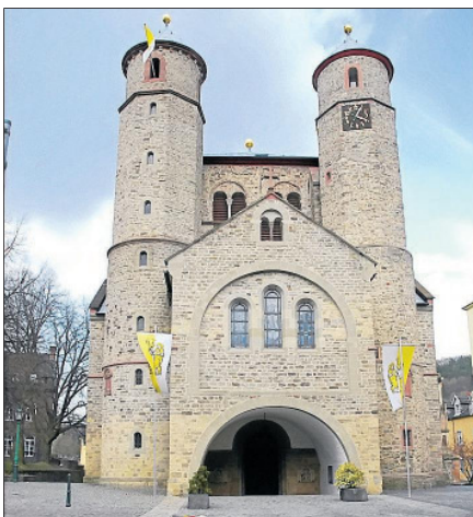
Pflastersteine vor der Stiftskirche deuten die Schlangen der Pilger zum Grab der Heiligen Chrysanthus und Daria an.